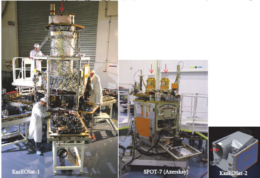
ՂՀ «KazEOSat-1», Ադրբեջանի «Spot-7» (Azerskay) ՀԵՀ արբանյակները, ՂՀ «KazEOSat-2» ՀԵՀ «նանոարբանյակը» (աջից)